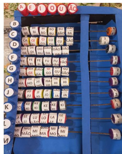
Figura 1. Parte superior do ábaco de português.

O desempenho de cada estudante foi analisado com base em Ferreiro e Teberosky (2007), que organizam os níveis da escrita em pré-silábico, silábico, silábico alfabético e alfabético. Para quantificar os dados obtidos, foi desenvolvido um sistema de pontuações, cada palavra escrita corretamente valia um ponto. Desse modo, o nível de cada aluno foi classificado com base na pontuação em: pré-silábico(0 a 2 pontos), silábico( 2 a 4) ,silábico alfabético ( 4 a 6 ), alfabético( 6 a 8).