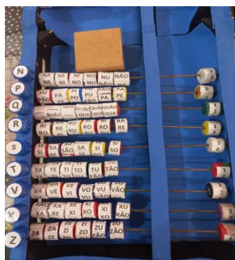
Figura 2. Parte inferior do ábaco .